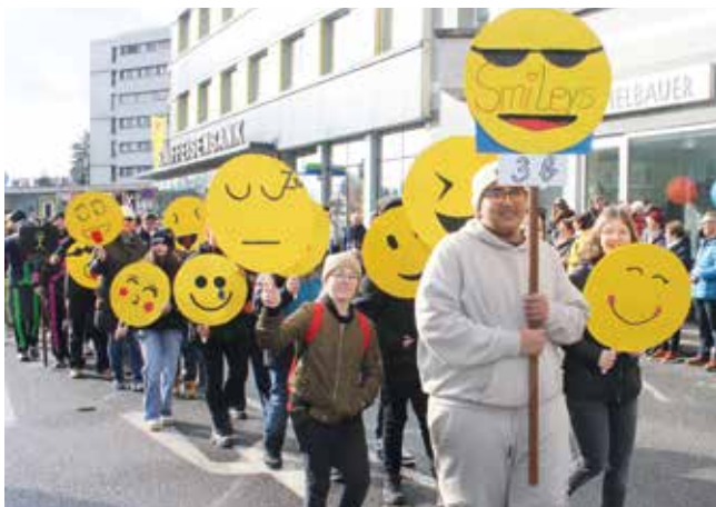
Die Schülerinnen und Schüler der 3B der Computermittelschule Wieselburg zogen als „Smileys“ durch die Straßen.