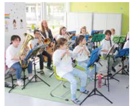
Der Schulchor und die Bläserklasse sorgten für eine herzliche Eröffnung