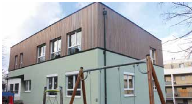
Außenansicht des Zubaus