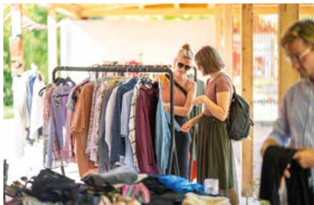
Tausch ma? Der Tauschmarkt erfreut sich immer größerer Beliebtheit.