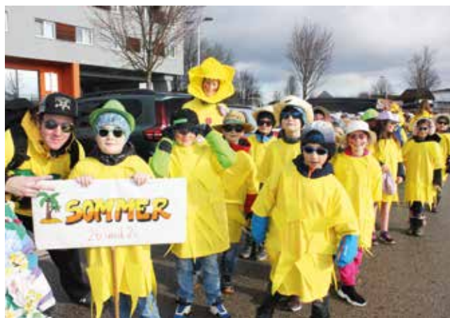
Die 2B und 2C der Volksschule Wieselburg brachten den „Sommer“ zum Faschingsumzug.