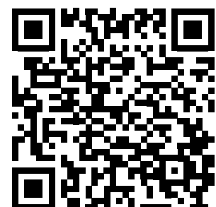
QR-Code zur Online-Umfrage

der Homepage der Stadtgemeinde und beim Bürgermeister-Frühstück am 4. Mai.