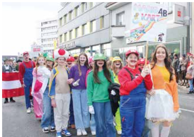
Die Welt von „Mario Kart“ war Thema der 4B des Gymnasiums Wieselburg.