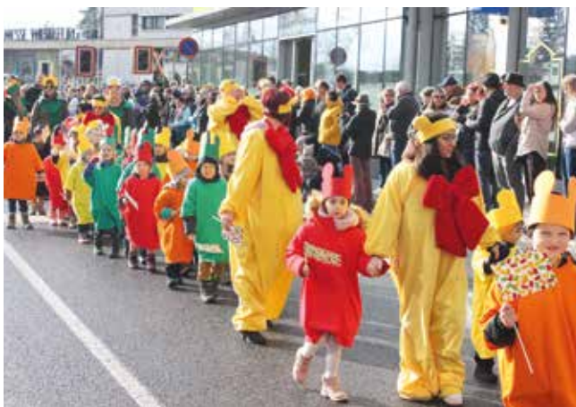
Als „Gummibärenbande“ verkleidet war der Kindergarten Mazzetti-Weg unterwegs.

wie die Verköstigungsmöglichkeiten entlang der Umzugsroute. Die Begeisterung seitens der Teilnehmerinnen und Teilnehmer sowie der Besucherinnen und Besucher war auf alle Fälle spürbar und sorgte für ein launiges Faschingstreiben in Wieselburg.