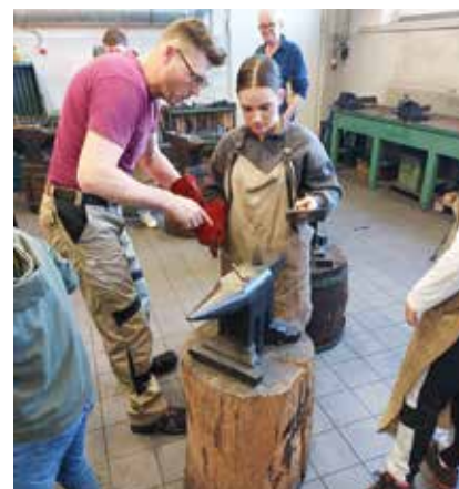
Spenglern und Schmieden - traditionelle Handwerke standen am Programm