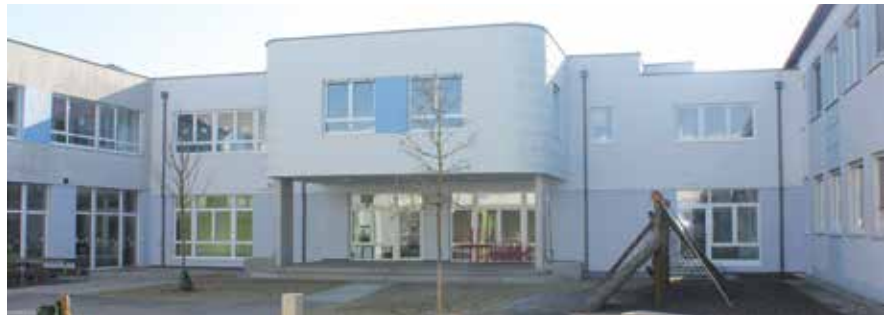
Der Zubau der Volksschule