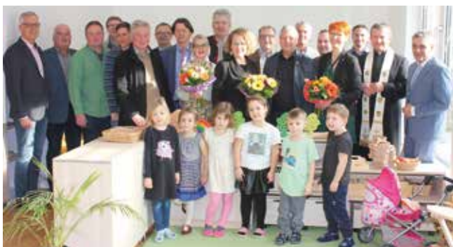
Einige der Ehrengäste mit Vertretern der bauausführenden Firmen und Kindern des Kindergartens Breiteneicher Straße

Die Kinder fühlen sich auf alle Fälle im neuen, hellen und modernen Zubau bereits sichtlich wohl.