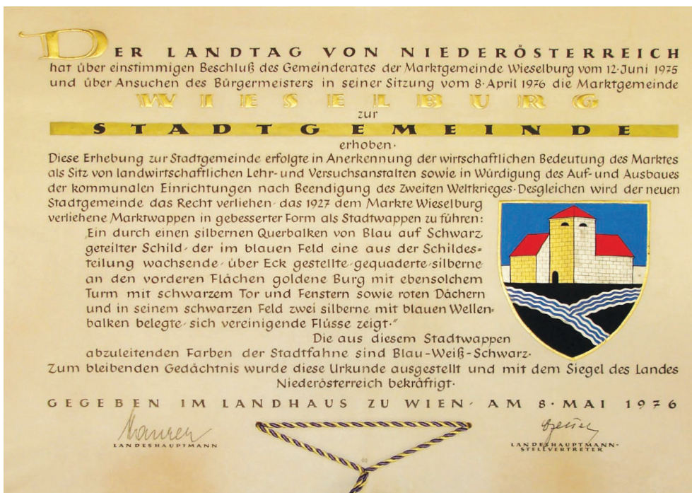
Die Stadterhebungsurkunde, unterschrieben von Landeshauptmann Maurer und Landeshauptmannstellvertreter Czettel

Ein Hinweis: Die beiden im Wappen sichtbaren Flächen des Turmdaches,