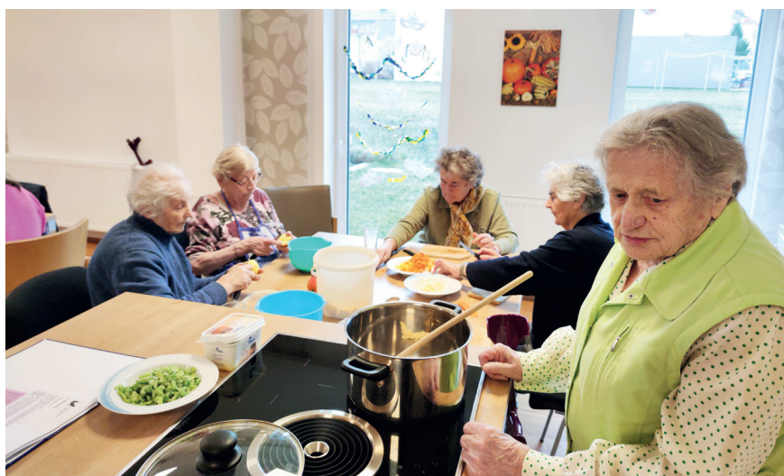
Zu einem strukturierten Tagesablauf mit professioneller Betreuung, angepasst an die individuellen Bedürfnisse und dem Leben in Gemeinschaft, zählt auch das gemeinsame Zubereiten des Mittagessens.

Für Rückfragen steht Ihnen Frau Ingrid Handl gerne unter (0 660) 155 51 78 bzw. tagesbetreuungszentrum@wieselburg.at zur Verfügung.