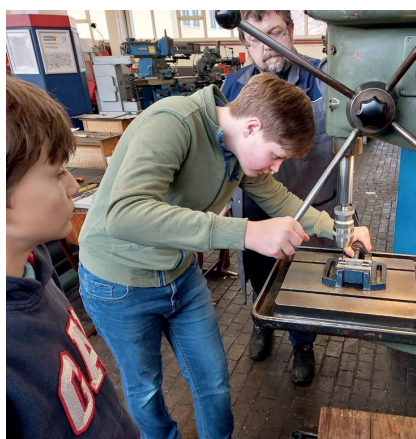
Genaueres Arbeiten unter Anleitung von Profis wurde von den Teilnehmerinnen und Teilnehmern bei der Metall-WerkStadt verlangt.