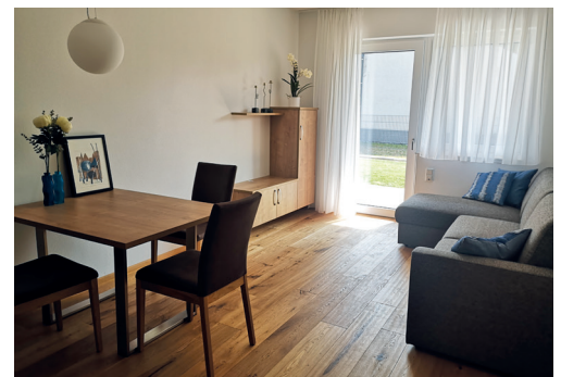
Eindrücke der Wohnvilla