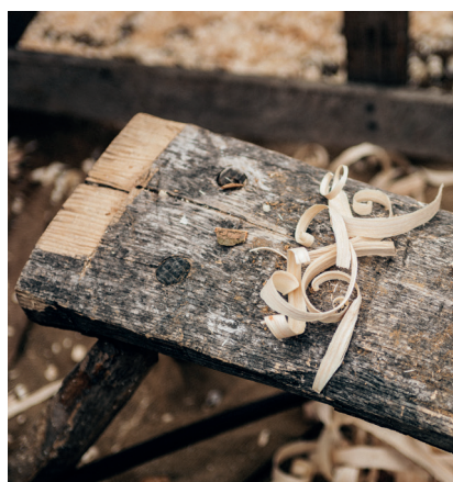
Am 14. Mai steht im Zuge der Holz-WerkStadt sägen, bohren und schleifen auf dem Programm. Noch sind einige wenige Restplätze frei - bitte um rasche Anmeldung.