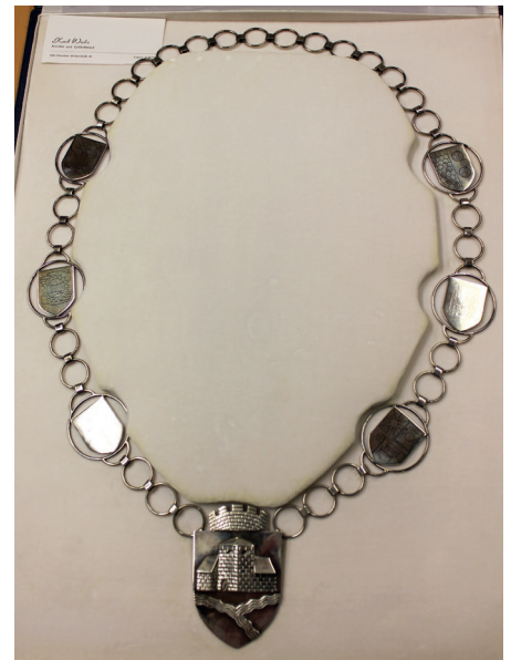
Die Bürgermeisterkette von 1976