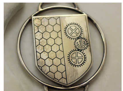
Der große Schild (oben) und zwei kleine Schilder (Mitte und unten) der Bürgermeisterkette.