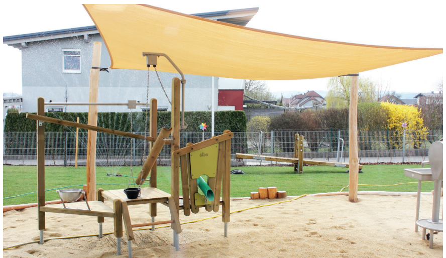
Der einladende Freibereich des neuen Kindercampus in der Getreidestraße

Ab dem Frühjahr 2022 wird den Kindern zusätzlich ein 2.500 m 2 großer Freibereich mit zahlreichen Spielgeräten zum Rumtollen, Austoben, Entdecken aber auch zum Entspannen geboten.