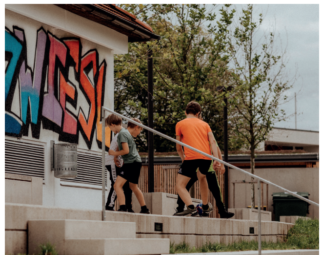
Die Jugendlichen dort abzuholen, wo sie anzutreffen sind - im öffentlichen Raum - ist ein wichtiger Anknüpfungspunkt von „JUSY on Tour“.