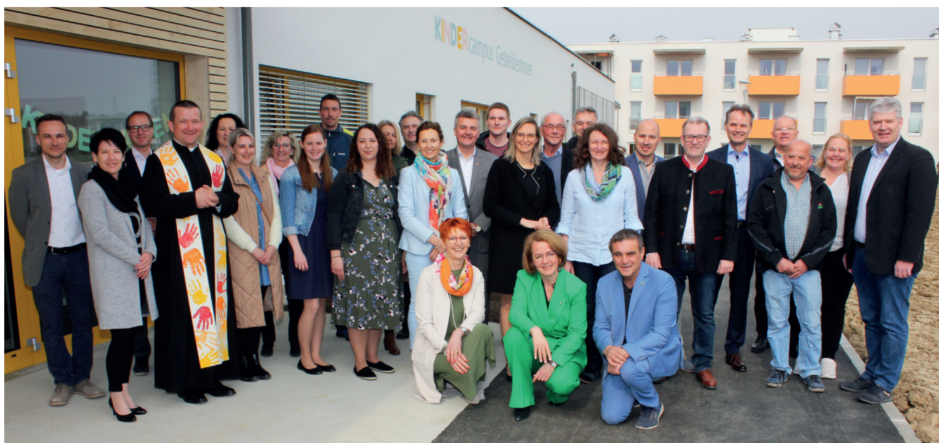
Viele zufriedene und strahlende Gesichter bei der Eröffnung des Kindercampus

Im Kinderhaus - für Kinder im Alter von einem bis drei Jahren - sind aktuell je