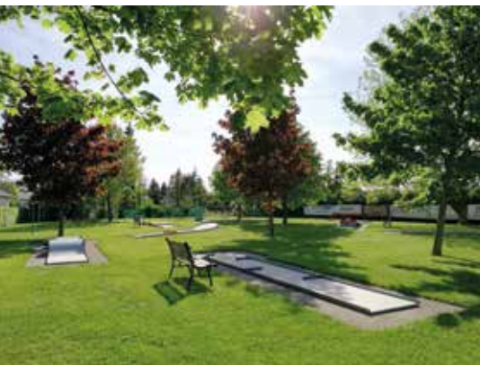
Ein Blick auf die Anlage des Bahnen Golf Teams beim Freibad in Wieselburg.

In den Sommermonaten ist die Anlage bei Schönwetter täglich von 14 bis 19 Uhr für Hobbyspieler geöffnet. Auch wenn Sie noch nie gespielt haben, besuchen Sie den Minigolfplatz und versuchen Sie ihr Glück bei einer gemütlichen Runde mit Ihrer Familie oder Freunden. Das Bahnen Golf Team freut sich auf Ihren Besuch!