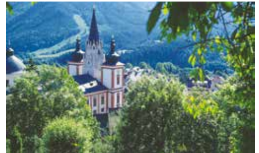
Mariazell - immer eine Reise wert!

Zu diesem Ausflug sind alle Wieselburger/-innen, egal ob Haupt- oder Nebenwohnsitz, ab dem 60. Lebensjahr sehr herzlich eingeladen. Sämtliche Kosten, mit Ausnahme der Getränke, die selbst zu bezahlen sind, trägt die Stadtgemeinde Wieselburg. Genaue Reisedaten wie Abfahrtszeit und Dauer des Ausflugs werden Ihnen nach erfolgter Anmeldung bekannt gegeben.