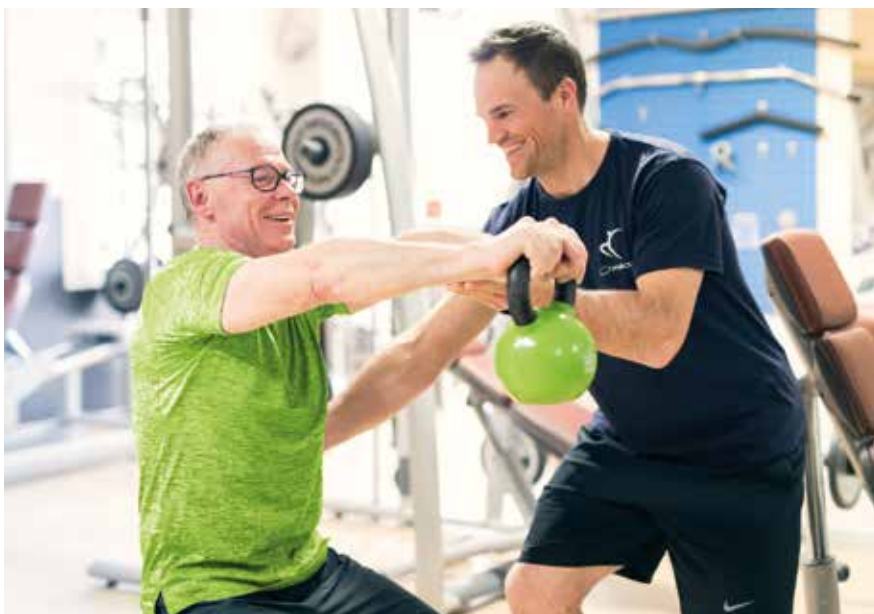
Professionelles Training bei Fitness Reiser