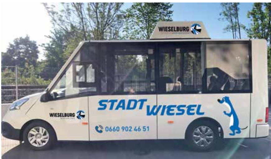
Der Stadtwiesel kurvt seit 1. Juli durch Wieselburg.

Je nach Bedarf sind auch weitere Einkaufstouren und Sondereinsätze möglich.