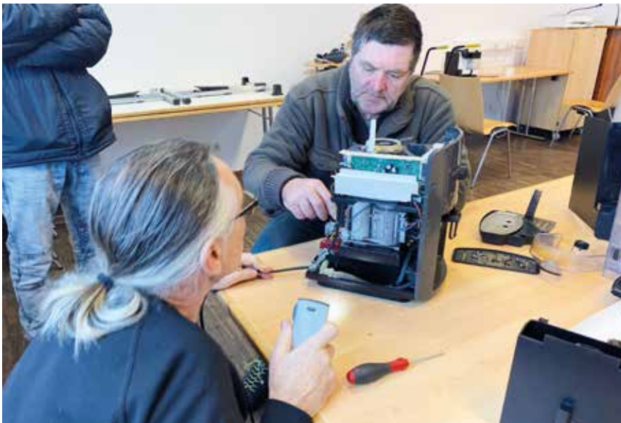
Defekte Kaffeemaschine? Kein Problem! Im Reparatur-Café Wieselburg wurden schon so einige Kleingeräte vor der Entsorgung bewahrt.

Wer nichts zu reparieren hat, kann zuschauen und lernen, anderen bei Reparaturen helfen oder bei Kaffee und Kuchen Erfahrungen austauschen.