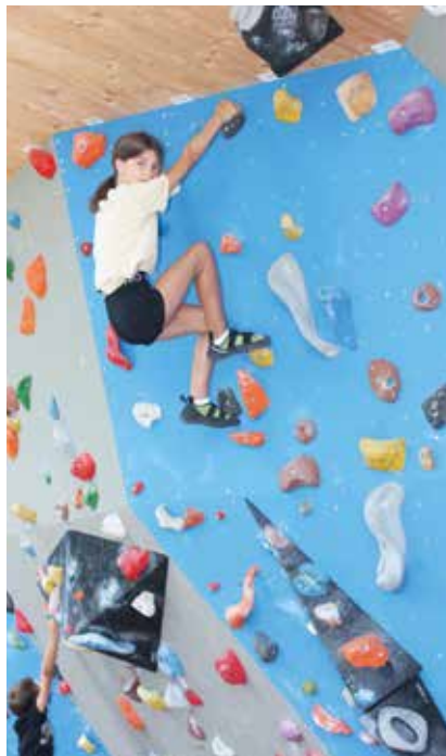
Fürs Klettern benötigt man eine große Portion Mut und Konzentration.