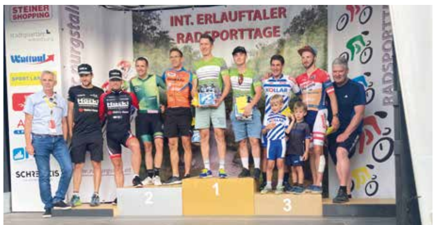
Auch Bürgermeister Josef Leitner (r.) ließ es sich nicht nehmen, den Gewinnern der diversen Rennen persönlich zu gratulieren.

Diese 50igste Auflage der Erlauftaler Radsporttage brachte für die Region einige sehr erfreuliche sportliche Erfolge und mit der großen internationalen Beteiligung und medialen Präsenz sicherlich wirtschaftlichen Zuspruch. Hoffentlich fand sie in der Bevölkerung viele neue Fans und Freunde für diesen tollen Sport!