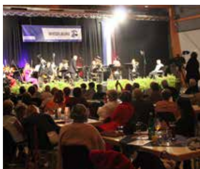
Einige Eindrücke von den beiden Abenden