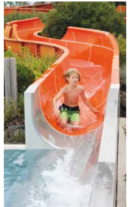
Beim Rutschcontest ging es für die Kids rasant zur Sache.