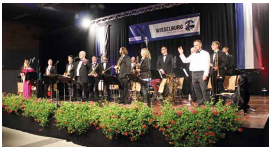
Das USA Phonotone Orchestra begeisterte über zwei Stunden lang das Publikum in der Wieselburger Halle.