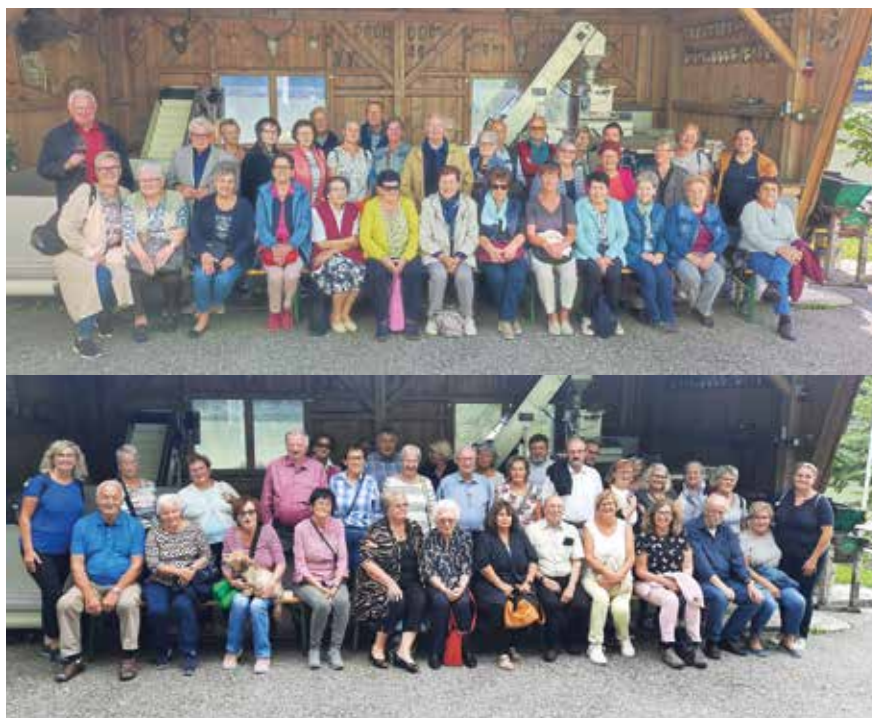
Gut gelaunte Teilnehmer/-innen beim Seniorenausflug 2022

Der Ausflug war ein voller Erfolg und die Teilnehmer/-innen verbrachten einige vergnügliche Stunden. Der Tenor nach der Heimkehr war auf alle Fälle eintönig: „Danke für diesen herrlichen Ausflug in geselliger Runde.“