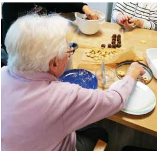
Auch beim Keksebacken zeigten die Seniorinnen und Senioren großen Einsatz.