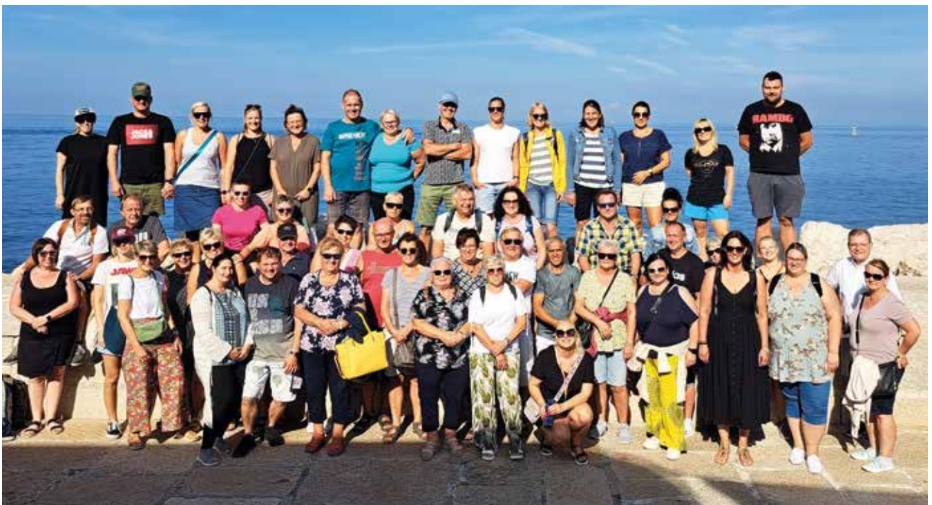
Über rege Teilnahme am diesjährigen Betriebsausflug durfte sich die Personalvertretung der Stadtgemeinde Wieselburg freuen.

Der Sonntag führte die Gruppe nach dem Frühstück nach Triest - der faszinierenden Hauptstadt der italienischen Region Friaul-Julisch Venetien. Nach einer ausführlichen Stadtbesichtigung ging es mit dem Bus retour nach Wieselburg. Ein gelungener Betriebsausflug, der von allen Beteiligten positiv angenommen wurde.