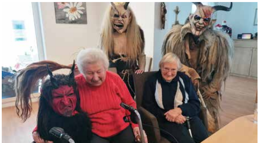
Egal ob Erntedankfest (o.), Nikolausfeier (M.) oder der Besuch von Perchten (u.) - im Tagesbetreuungszentrum ist immer etwas los und die Tagesgäste fühlen sich wohl.