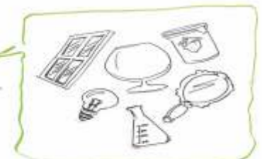
Glasscheiben, Glasgeschirr, Einmachgläser, Glühbirnen, Spiegel, Laborgläser

Steigerung der Energieeffizienz durch kontinuierliche technische Weiterentwicklung