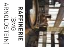
RAFFINERIE (BMG ARNOLDSTEIN)